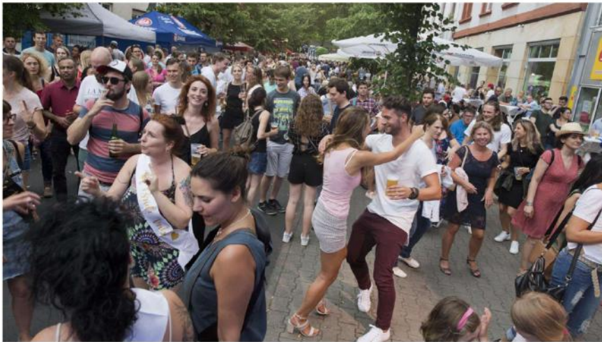
So sah es vor Corona beim Fest auf der Schweizer Straße aus.

Läden an der Schweizer Straße im Frankfurter Stadtteil Sachsenhausen dürfen nun doch nicht beim Schweizer Straßenfest am Sonntag öffnen. Was dahinter steckt.