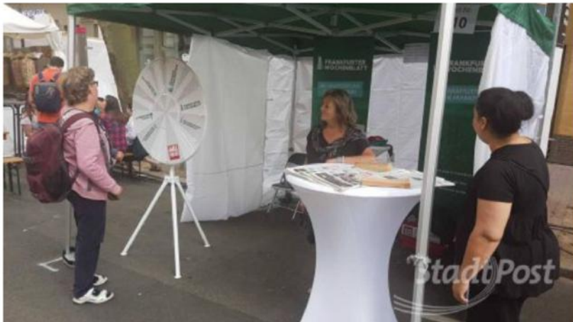
Am Stand des Frankfurter WochenBlatts konnte man sich am Glücksrad versuchen.

Sachsenhausen (red) – Darauf hatten sich viele gefreut: Das Schweizer Straßenfest wurde endlich wieder gefeiert. Entsprechend groß war der Andrang an beiden Tagen.